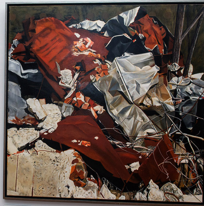
Jovián György Rot und Weiß 2016